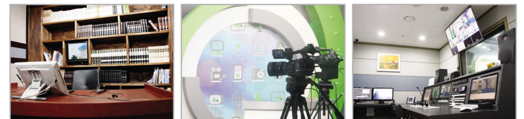
▲ 무인 자동화 스튜디오