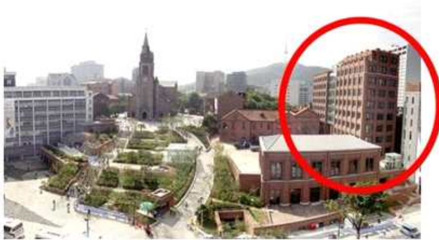
명동성당 기준으로 오른쪽 붉은색 높은 벽돌 건물이 교구청 신관입니다.