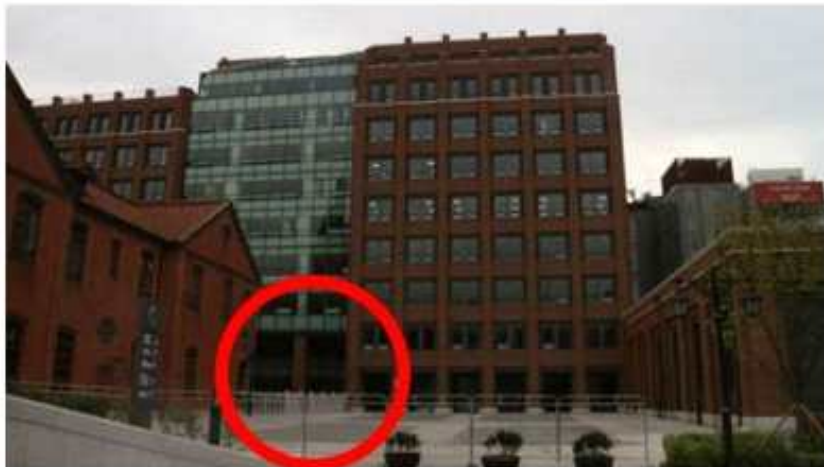
붉은 색 동그라미 쳐져 있는 곳으로 들어오셔서 5층으로 올라가시면 됩니다.